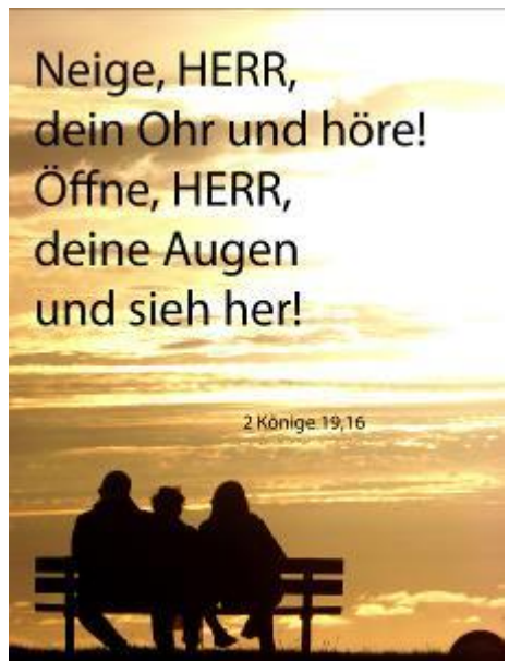
Monatsspruch für den August 2021