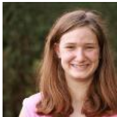
online nicht verfügbar