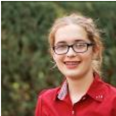
online nicht verfügbar