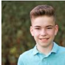
online nicht verfügbar