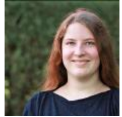
online nicht verfügbar