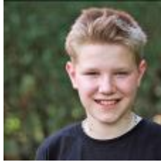
online nicht verfügbar