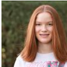
online nicht verfügbar