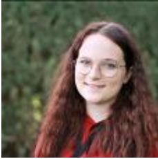
online nicht verfügbar