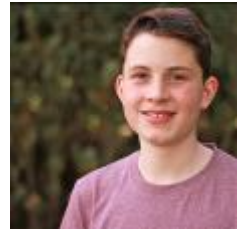
online nicht verfügbar