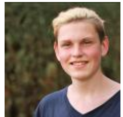
online nicht verfügbar