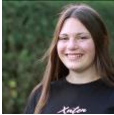
online nicht verfügbar