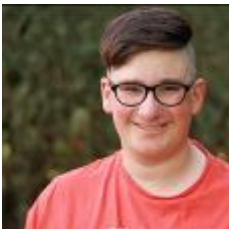
online nicht verfügbar