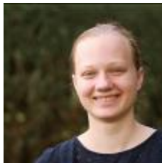
online nicht verfügbar